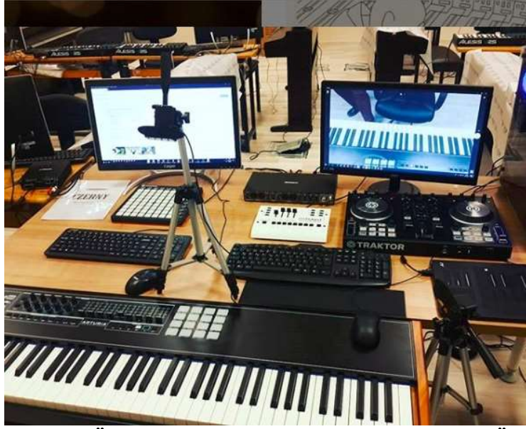
Resim 2. Burdur MAKÜ Müzik Teknolojileri Midi-Piyano Lab. Öğretmen Masası