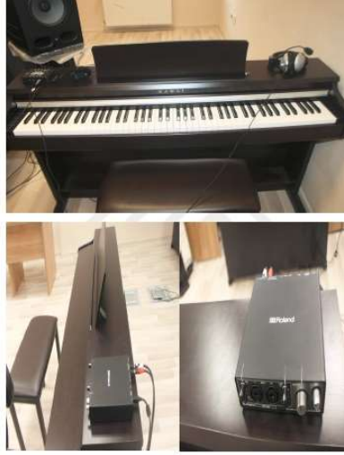
Resim 5. Öğretmen Piyanosu