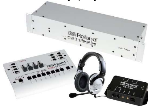
Resim 1. Roland GLC-1 Lab. Sistem

1 Adet Laboratuvar Konferans Sistemi : Bu sistem 1 adet öğretmen modülü Workstation, piyano sayısı kadar da öğrenci modülüne ihtiyaç duyar.