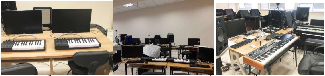
Resim 3. MAKÜ Müzik Teknolojileri Midi-Piyano Lab. Öğrenci ve Öğretmen Masası