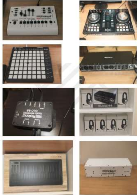
Resim 6. Ekipman Örnekleri